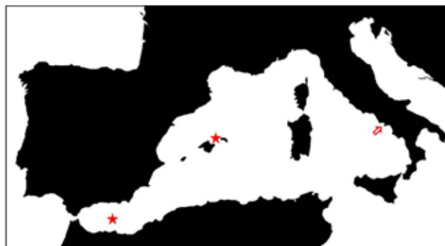
Figura 1. Mapa del Mediterráneo occidental con la distribución de Micrura dellechiajei . Flecha: golfo de Nápoles, localidad tipo y únicas citas conocidas hasta este trabajo (Hubrecht, 1879; Bürger, 1892, 1895). Estrellas: nuevas citas de la especie en el canal de Menorca y en el mar de Alborán.

Los ejemplares estudiados provienen de las campañas oceanográficas CALMEN07 y CALMEN08 realizadas en el canal de Menorca en julio de 2007 y 2008 respectivamente, y de la ALBORÁN-INDEMARES, realizada en las proximidades de la isla de Alborán en septiembre de 2011. Las muestras en que apareció la especie se recogieron con la draga de roca y el bou de vara, a profundidades situadas entre los 61 y 101 metros (Figura 1).